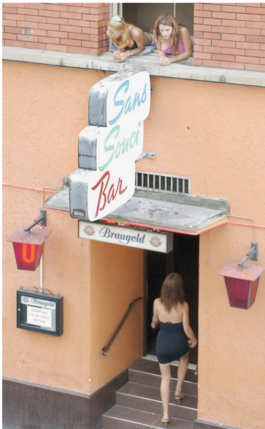
La prostitution dans les bars ou cabarets pourrait être autorisée à Neuchâtel.