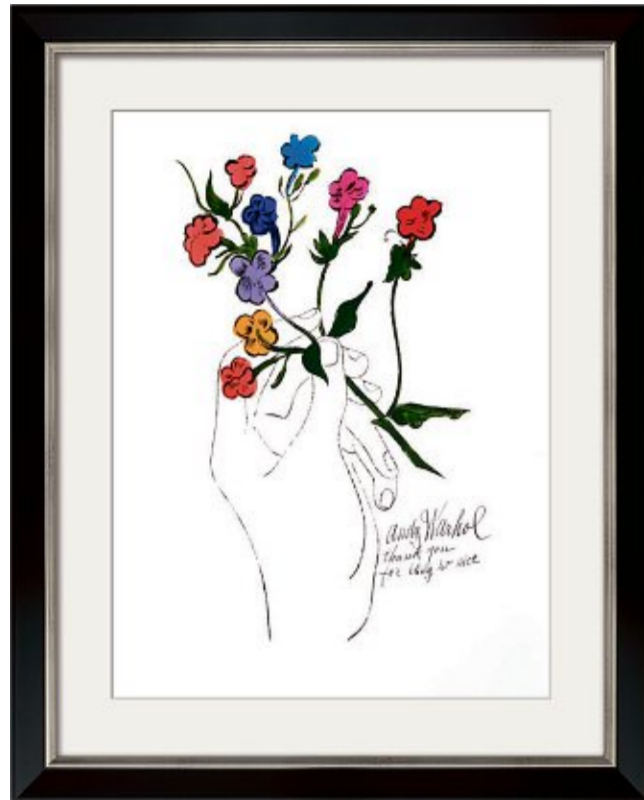
©#/TM 2023 The Andy Warhol Foundation for the Visual Arts, Inc.

Plus d'art sur www.classic-art.ch/fr | Politique de retour de 14 jours | Service clientèle suisse: 044 244 51 51